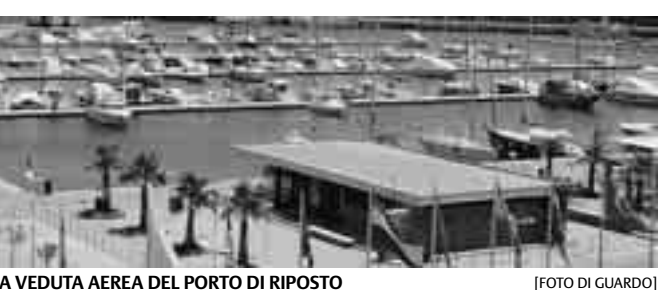
UNA VEDUTA AEREA DEL PORTO DI RIPOSTO

«La maggior parte dei turisti - osserva il presidente della Proloco Riposto - ci ha chiesto informazioni, oltre che sulle località "classiche" come Taormina, l'Etna, Aci-reale e Catania, anch'essi posti da visitare a Riposto e nei centri vicini». Senza dubbio, un veicolo di promozione turistica è stato il cartellone "Riposto Summer Events", allestito dal Comune, che fino al 28 settembre continuerà a proporre eventi artistici, culturali e musicali di rilevanza nazionale e internazionale. Estate positiva anche per il porto turistico dell'Etna "Marina di Riposto", dove continuano ad ormeggiare super yacht e panfili di lusso con a bordo celebri personaggi del mondo dello spettacolo e vip. Di recente, nel "Marina di Riposto" è approdato il "Freedom", il "gommone yacht" dello stilista toscano Roberto Cavalli, in vacanza con la giovanissima fidanzata Lina Nilsson.