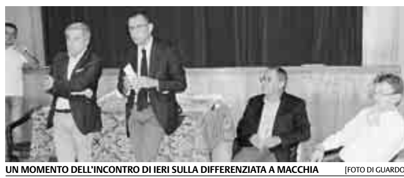
UN MOMENTO DELL'INCONTRO DI IERI SULLA DIFFERENZIATA A MACCHIA